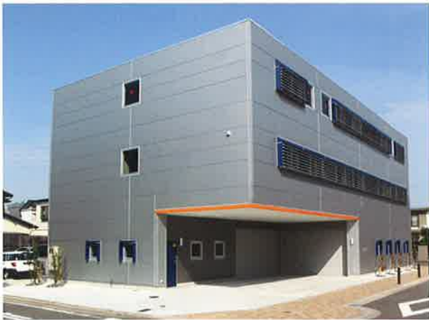
キャリブレーションセンター