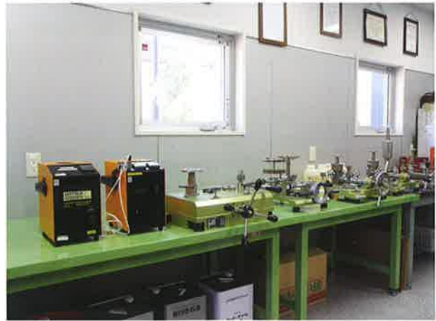
※当社所有の標準器群